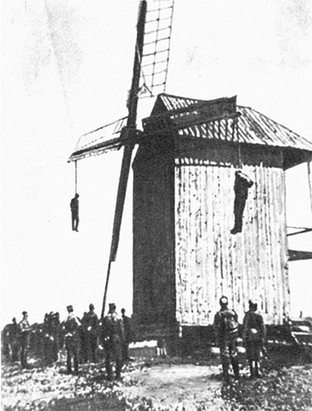
Страта учасників повстання у с. Каніж Херсонської губернії, 1918 р.

Усього в селах України протягом 1918 р., за попередніми даними, сталося близько 600 антиурядових збройних виступів [116] .