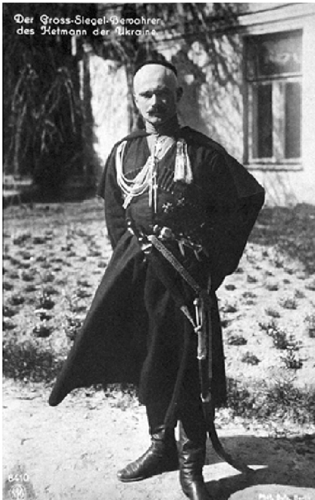
Der Gross-Siegel-Bewahrer des Hetmann der Ukraine