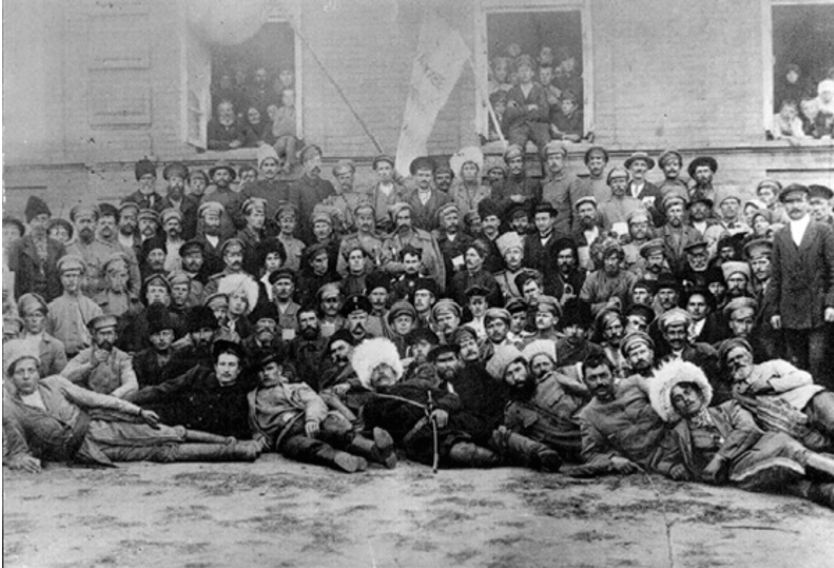
Учасники Всеукраїнського з'їзду Вільного козацтва. Чигирин, жовтень 1917 р.

Найменше делегатів було з Поділля та Волині.