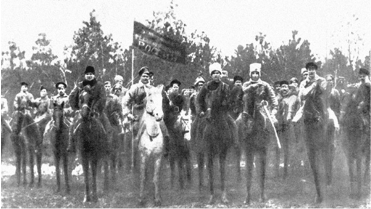
Партизанський загін кіннотників

своими многочисленными жалобами она обратилась к германцам, ища у них защиты» [111] .