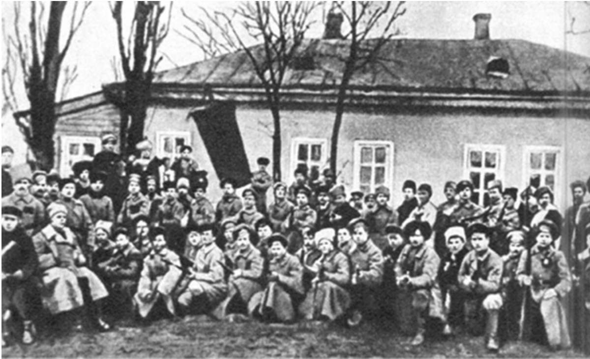
Партизанський загін Городнянського повіту Чернігівської губернії