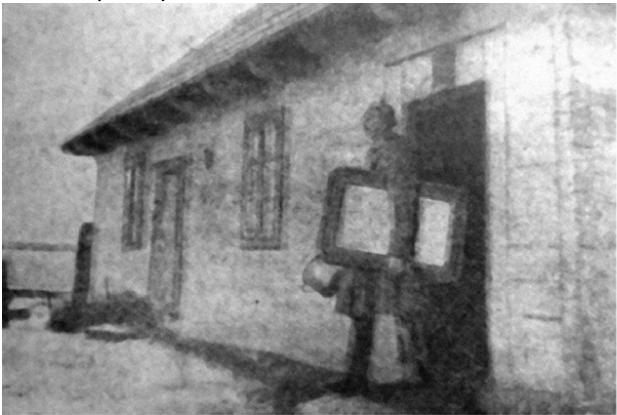
Мародерство в українському селі

До несправедливих і вкрай жорстоких репресій додавалося здирництво. Як колективне покарання військові застосовували стягнення з громад великих штрафів (так званих контрибуцій). Крім штрафів військові й варта вилучали кошти для відшкодування власникам великих господарств, які постраждали від погромів. Стягнення іноді сягали кількох сотень тисяч карбованців. Також іноземні війська реквізували продовольство. Непоодинокими були відверті грабунки – солдати і вартові нищили по селянських хатах, забираючи усе, що впадало в око.