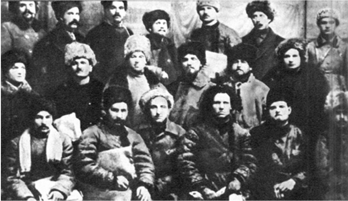
Партизанський загін Павлоградського повіту Катеринославської губернії

Отже, навіть ту частину селянства, яка відчувала ворожість до уряду, було не так просто втягнути в антиурядову збройну боротьбу. Масові сутички виникали здебільшого тоді, коли учасники повстання були впевнені у перемозі. Найбільшими були повстання травня-липня 1918 р., коли відбувалося становлення гетьманської державної системи і діячам попередніх режимів (українського республіканського і радянського) здавалося, що в гетьмана немає надійних сил і широкої підтримки в суспільстві, що варто в будь-якому з регіонів розпочати виступ, як до нього відразу ж приєднається усе місцеве населення, а слідом спалахне вся країна. Саме ця думка надихала ініціаторів і ватажків Звенигородського повстання червня-липня 1918 р. [114] , яке стало найбільшим з усіх антиурядових збройних виступів проти влади гетьмана П. Скоропадського.