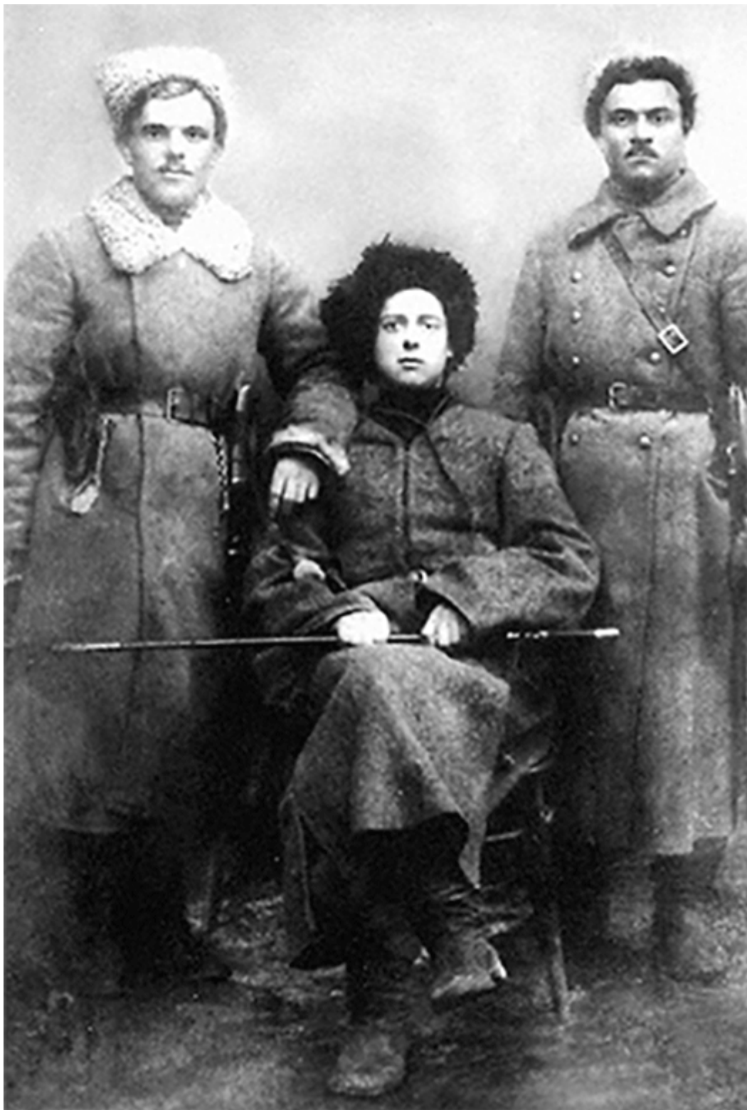
Зелений (Данило Терпило) – отаман Дніпровської дивізії (у центрі). 1919 р.