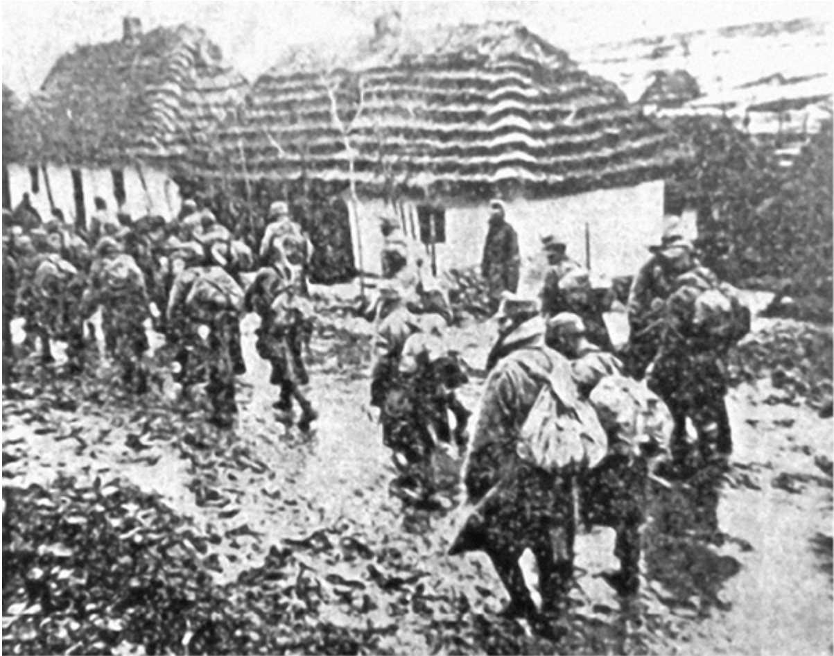
Австро-угорські вояки в українському селі, 1918 р.

недостатньо для боротьби з масовими порушеннями. За браком власних сил гетьманська влада була змушена покладатись на допомогу австро-угорських та німецьких військ.