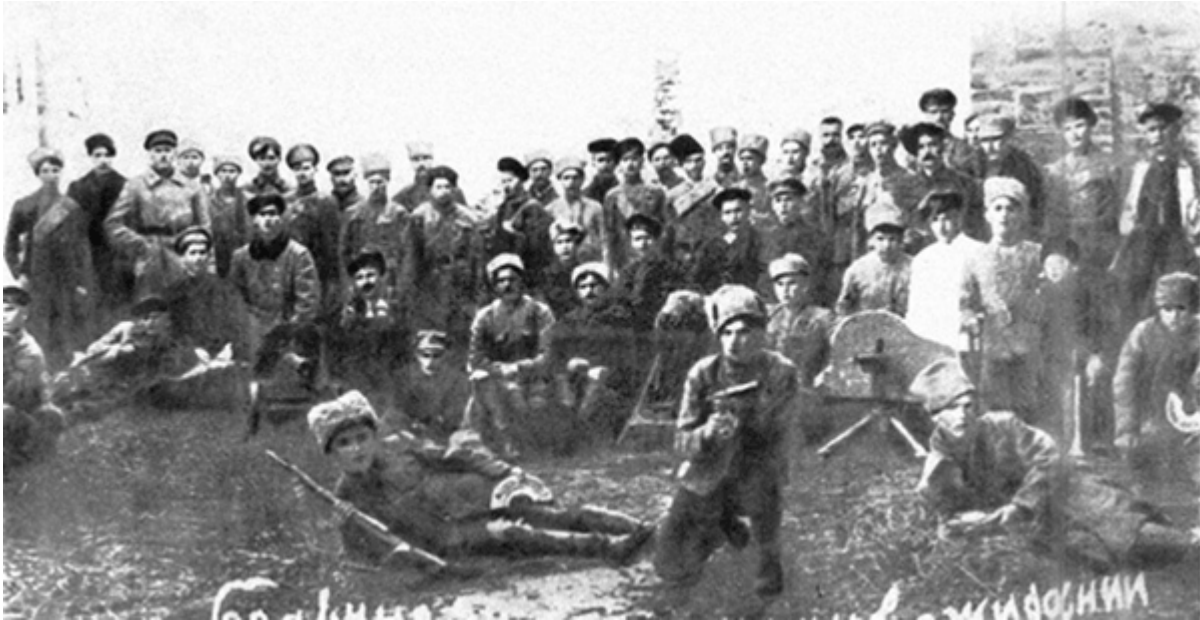
Партизанський полк Таращанського повіту Київської губернії

факты, народу жилось лучше в общем, нежели раньше и позже, так как все-таки была какая-то власть и намечался порядок. Всякий хозяин знал, что он может выйти на свое поле и что результат работ будет его; он знал, что никакие набеги на его дом разрешены не будут и т. д. И вот почему только бездомная голытьба участвовала в восстаниях Петлюры и Шинкаря» [107] .