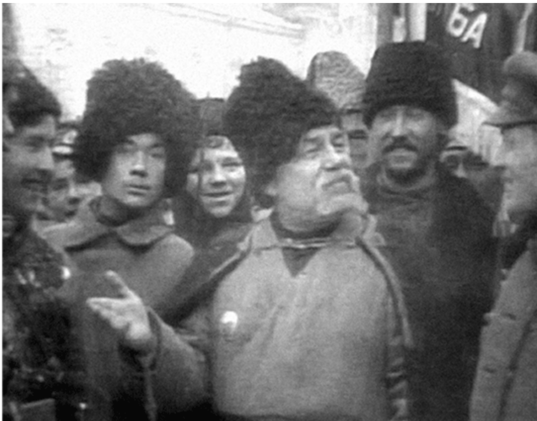
Парад Вільного козацтва на Софійській площі. 17 грудня 1917 р. Кадри кінохроніки

Не варто забувати й про настрої селянства, яке крізь призму власного розуміння понять «право», «закон», «справедливість» особливо схвально сприймало більшовицький заклик «Грабуй нагробоване!». Обрані на сільському сході або й самопроголошені селяни-козаки, до того ж переважно молодь, навряд чи могли висловлювати думку, яка відрізнялася б від «загальнонародної» позиції сільського натовпу. Тому сільські загони Вільного козацтва часто були не в змозі протистояти погромам, які чинили їхні односельці. І це в тому разі, коли вони намагалися зупиняти погроми, а не самі брали в них участь! Для розуміння подібних фактів має велике значення думка бердичівського повітового