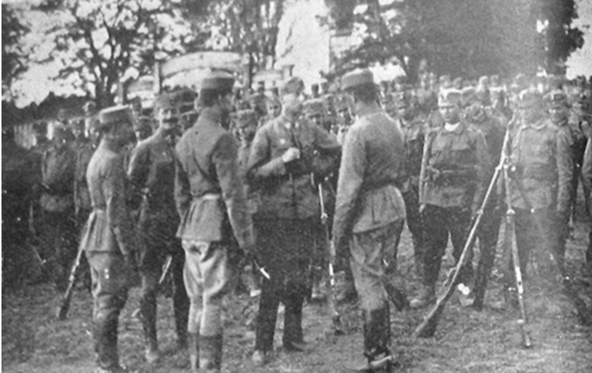
Ерцгерцог Вільгельм і Українські січові стрільці, с. Грузьке Херсонської губернії, 1918 р.

Замість розбороняти учасників громадянського конфлікту війська Центральних держав і українські правоохоронці нерідко ставали на бік одного з них. Найчастіше вони підтримували великих землевласників проти дрібних: на прохання поміщиків, оминаючи примирні комісії, стягували з селян компенсацію за зруйновані маєтки. Зазвичай це був іще один прояв корупції – частина сплачених селянами грошей ішла до кишені посадовця, який здійснював стягнення [94] .