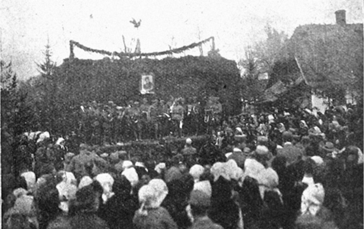
Оркестр Українських січових стрільців виступає перед селянами поблизу Миколаєва, 1918 р.

Підрозділи з українців-галичан у складі австро-угорського контингенту в Україні, навпаки, часто-густо боронили інтереси селян.